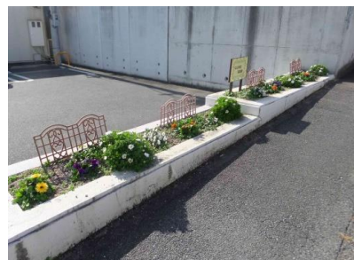
ローソン横歩道の花壇