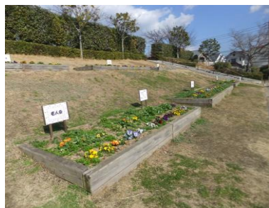
西児童公園の花壇

※現在、西児童公園の中央部分の芝生は育成中で立入禁止にしています。ご協力をお願いします。