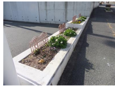
ローソン横歩道の花壇