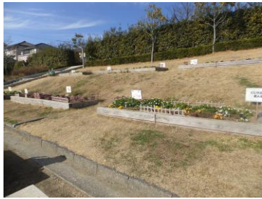
西児童公園の花壇

※現在、西児童公園の中央部分の芝生の育成中で立入禁止にしています。ご協力をお願いします。