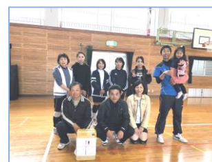
《優勝Aチームの皆さん》